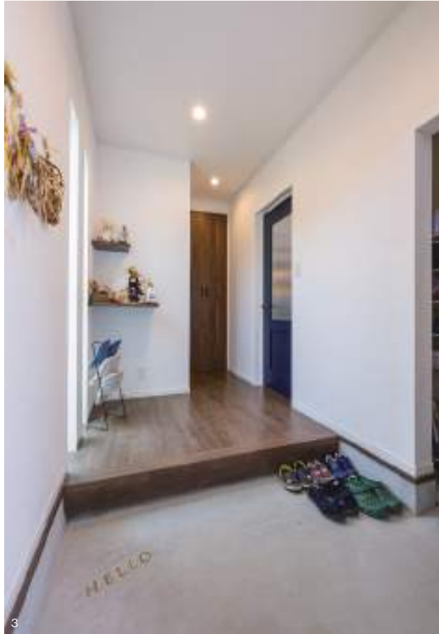
1. 3LDKというH邸間取りの中心となる1階LDKは、ご夫妻の理想をかたちにした21帖という大スペース。モルタル調をあしらったキッチンカウンターをアクセントに清潔感あふれる空間が広がる。2. キッチン背後はモルタル調の収納とレンガ風クロスでアレンジ。3. 便利な土間収納のある玄関空間。室内全体で統一されたフロアの木目ブラウンにトイレ扉も合わせてある。4. 古くからの住宅街にたつH邸。足場材風の外壁とモルタル調の外壁のツートンで構成される。