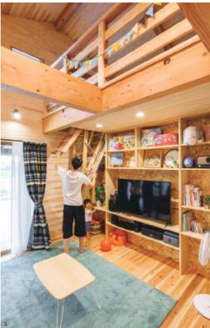
1. 大きな切妻屋根とグリーンの外壁が出雲平野にも馴染む外観。 2. 思う存分アメリカンを追求した洗面。オープンフロアにある洗面所には、タイル柄のクッションフロアを貼り、丸角の大きな黒縁ミラーとエジソンランプでレトロな雰囲気を出している。 3. ロフトへは、折り畳み収納式タラップで。普段は天井部分に仕舞えるため、リビングを広く使うことができる。 4. 広い玄関を家の中心に配したレイアウト。家族の気配を互いに感じやすく、使い勝手も高い。