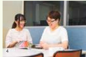
1 自由な発想でクオリティの高いプロモーションを展開する山広の社員 2 幅広く情報をキャッチして、顧客ニーズ掘り起こしに奔走する営業スタッフ 3 作成した島根県立中央病院の季刊誌が、優れた広報活動をしている病院を表彰する《病院広報アワード2023》で優秀賞受賞 4 企画から媒体の作成まで、営業と制作の両スタッフが密に連携し、地域の課題解決を意識した広告提案につなげる