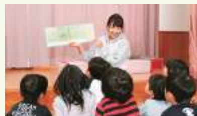
女性職員が多く、ライフステージが変化しても、いきいきと働ける体制を整備している