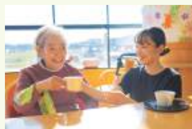
ご利用者や患者さんはもちろん、働く職員たちも笑顔で輝くことができる環境だ

最も大切な資源である職員が、仕事でもプライベートでも、心が充実し豊かに暮らせるように福利厚生も手厚い。ここ数年は、新型コロナウイルスのため行事は中止、会議や研修もオンラインで行われていたが、5類移行に伴い徐々に行事も再開している。例年、職員旅行は日帰り・海外を含む約10コースから選択できる。法人補助があるので費用面でも職員にやさしく、一年の楽しみもなっている。毎年10月にはグループ全体の大運動会や、年数回行われる互助会主催の親睦会など趣向を凝らしたイベントも多い。普段顔を合わせる機会が少ない各事業所の職員が一堂に集まり、スポーツを通じて交流を深めている。