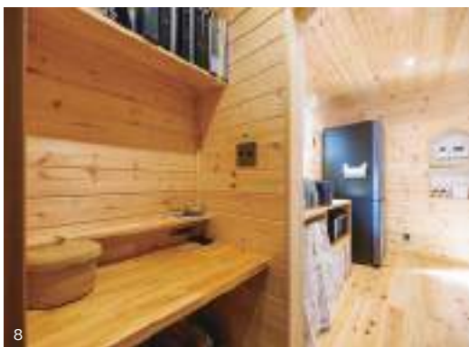
7. ファミリークローゼットからミニデスクコーナーを介してキッチンを見る。デスク背面がパントリーになっている。クローゼットはリビング側にも扉があるので、キッチンを軸に回遊できる設計になっている。8. 奥様の念願だったデスクコーナー。もちろんオール無垢仕上げ。9. 省スペースながら室内干し機能も万全な洗濯脱衣室。