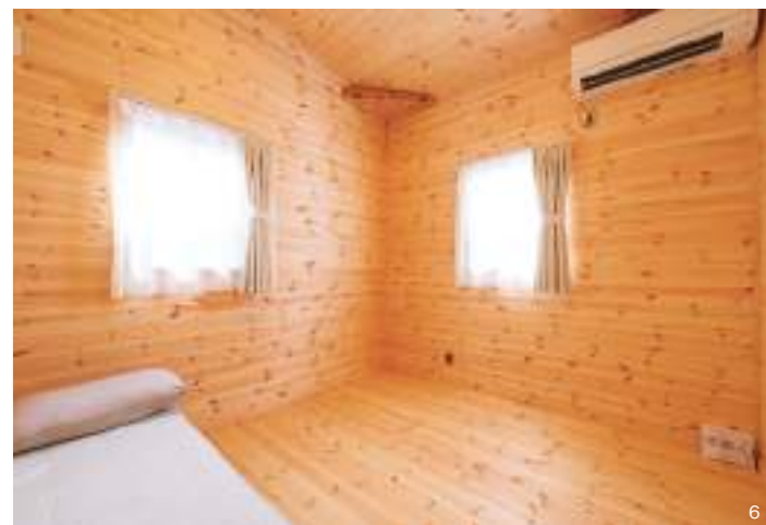
5. 対面キッチンのカウンターとダイニングテーブルを一体化。調理や配膳にかかる時間や労力のすべてがこのカウンターを隔てた限定スペースで完結する。6. 主寝室。シンプルになればなるだけ素材感が立ち上がる「CUTE」らしさに溢れた空間だ。