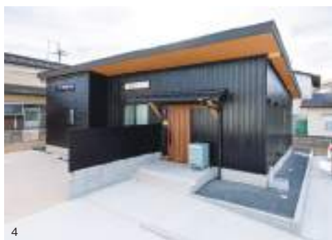
1. 屋根裏まで使い切ったヴァーティカルな開放感たっぷりのリビング空間。掃き出し開口からの採光も申し分なく、部屋の隅々まで行き渡る光が無垢の素材感を際立たせている。奥に見える三角デザインの入口がバス・トイレで、玄関からすぐにアクセスできる位置になっている。2. シンプルだが機能性十分なキッチン。奥の扉がファミリークローゼット。3. スペースとしてはコンパクトだが、土間に専用の収納スペースを備えた玄関。三角ニッチがアクセント。4. 焼杉板で仕上げられた外観。ブラックの外壁にライトブラウンの軒裏がよく映える。

うNご夫妻。そのナチュラルな素材づかいとともに、スペース効率を重視した家づくりを希望していたこともあり、動線を極力なくした高効率な空間設計が持ち味の「CUTE」らしさが遺憾なく発揮された仕上がりになっている。 大屋根の勾配を活かした、縦の開放感抜群のLDKを中心に、「外の汚れをリビングに持ち込まない動線」を希望したご主人に応え、帰宅後すぐに洗面コーナー、バス・トイレに直行できるように、ランドリーコーナーを含む水回り関係を玄関の東側に動線なしで配置。その玄関もコンパクトながら、収納用の土間スペースもあり機能性は十分だ。