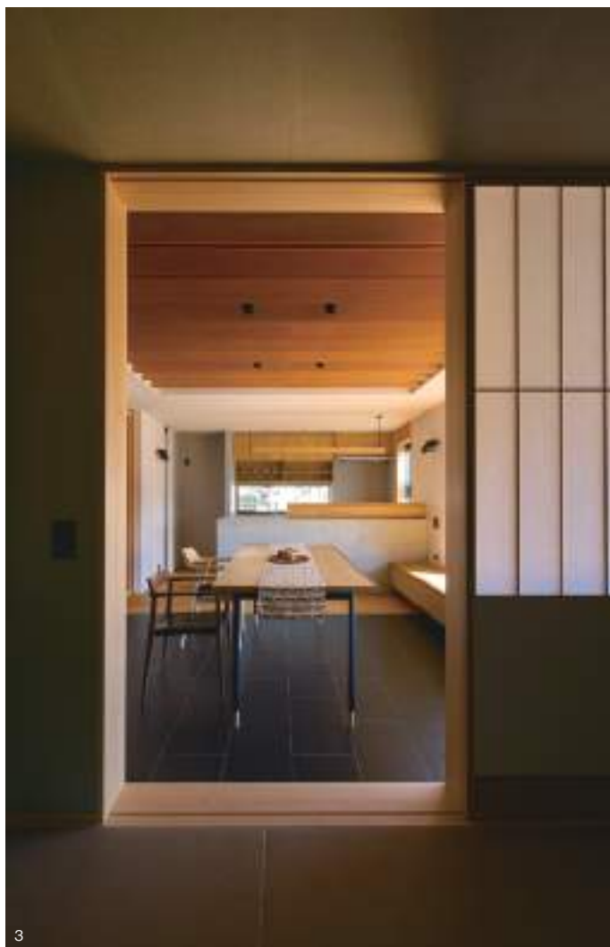
1.4. この家最大の魅力はダイニング。アートフレーム風の衝立壁と現代版築地松をイメージしたという外構を組み合わせた眺めを借景込みで楽しめる。視線誘導する天井の意匠、厚みを見せないようエッジ加工した衝立壁、室内に向けて勾配をつけた外構といった、そのコンセプトをより明確にする工夫が随所に凝らされている。開口に沿って設えた造作ベンチは幅60cmとソファや簡易ベッドとしても使えるスグレモノ。2. 造作家具と組み合わせたキッチンユニットには、造作部分と同じタモ材でアレンジして統一感を高める。3. 小上がり和室からDKの眺め。