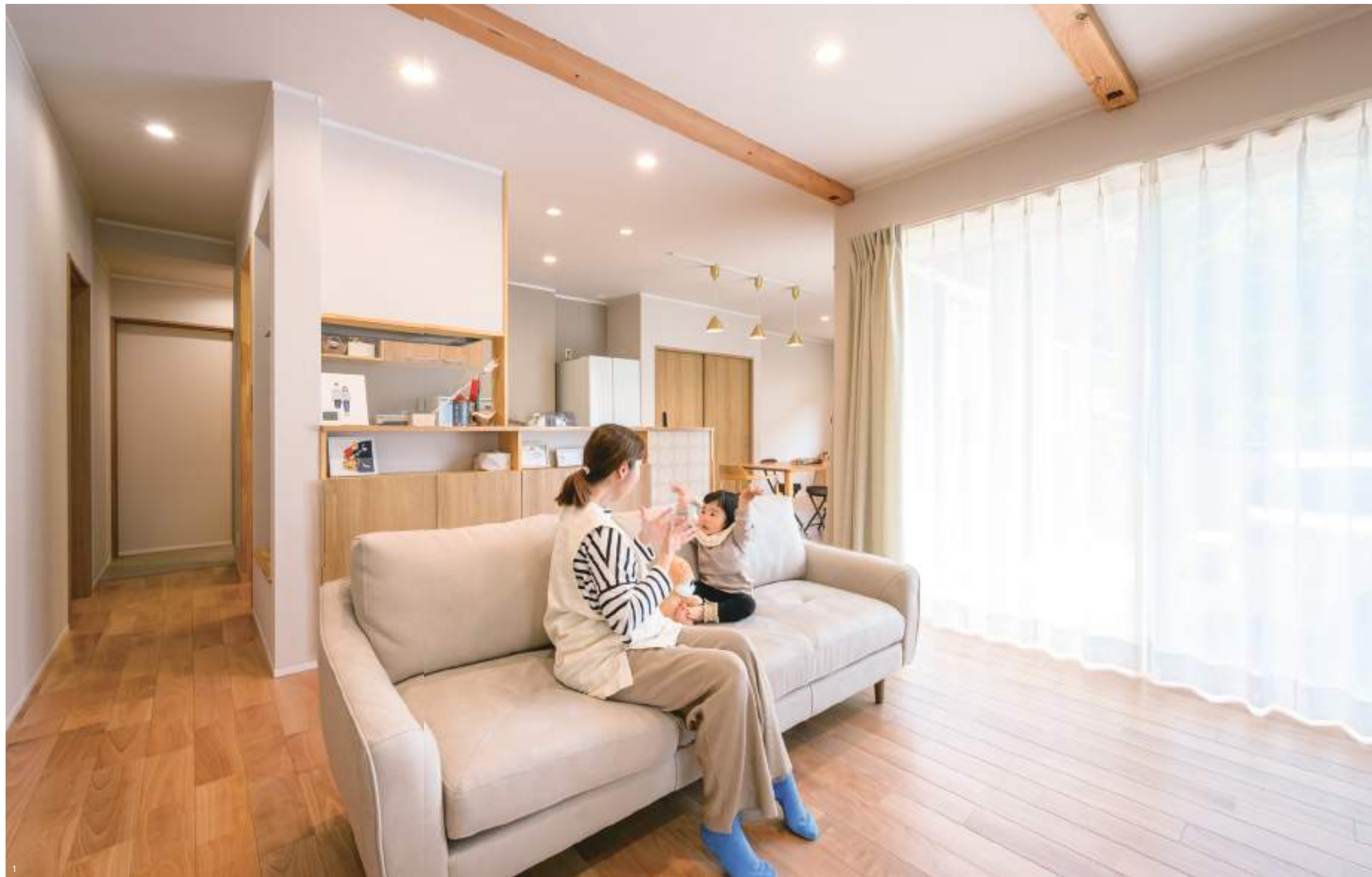
1.L字型の間取りを活かして南東2面設えた開口からの陽当りが最高なLDK。サクラ材を使用した無垢フロアのマットな質感も明るい空間によく似合う。 2.LDKをダイニング側から眺める。大容量のファミクロなど、拡張性に富むのもH邸の特徴。3.三角屋根風の垂れ壁が印象的なシューズクロークはたっぷりサイズで設計。 4.焼杉板とガルバリウム鋼板のツートンで構成した外觀も、職人集団「藤原建築工務店」ならではの見事な仕上がりに。整然とデザインされた外構との相性も抜群。