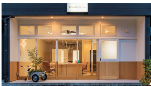
1 本店CERIO (ヘア・ネイル・まつエク)。店舗外壁のレンガは200年以上前にイギリスで使われていたものを輸入 2 春日 (ヘア・エステ・ネイル・まつエク) 3 AR (ヘア・エステ・ネイル・まつエク) 4 YONAGO (ヘア・エステ・ネイル・まつエク・ブライダル) 5 IZUMO-在 (ヘア・エステ・ネイル・まつエク・ブライダル) 6 2022年にオープンしたIZUMO 白-haku- (ヘア)