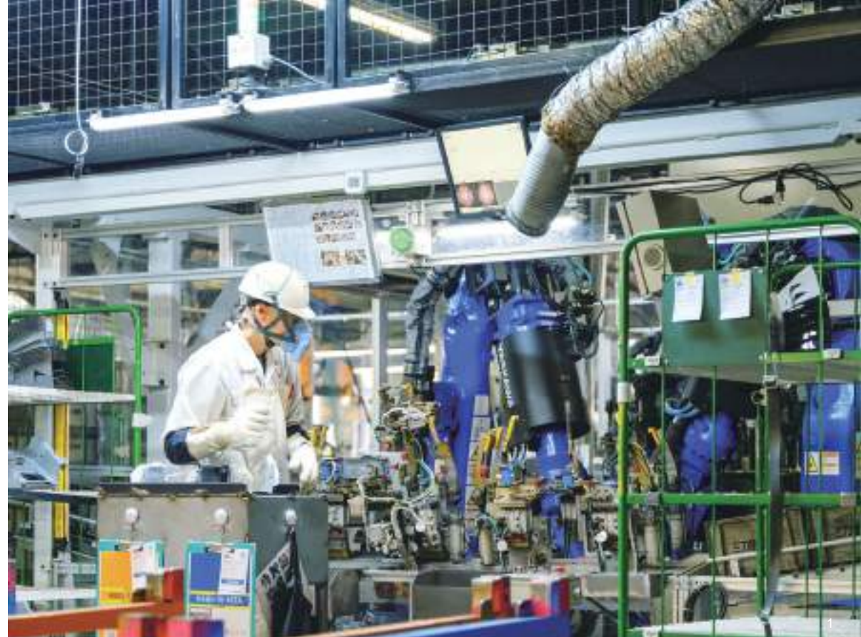
1 中小物のプレス品はロボットを活用した自動ラインで溶接を行い、骨格となる重要な部品を生産する 2 2022年から代表取締役を務める久留主社長。キーレックスのプレス技術領域に長年携わっていた 3 敷地内に設けられている「技能実践道場」。従業員の技術を磨くシステムが整えられている 4 お昼休みのひととき。女性社員も多い