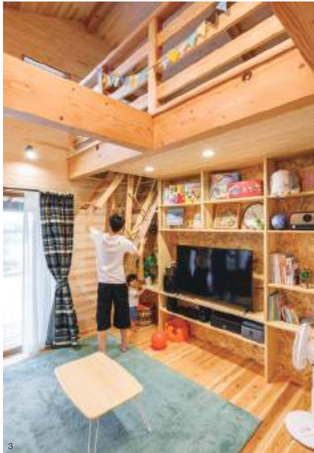
1. 床や天井、壁にふんだんに天然木を使って、ログハウス風に仕立てたLDK。玄関ホールとの境は斜めに仕切り、奥行きと個性を創出した。キッチンのOSBボードとネイビーのカウンターが空間のアクセントに。2. 広い玄関を家の中心に配したレイアウト。家族の気配を互いに感じやすく、利便性も高い。3. ロフトへは、折り畳み収納式タラップで。普段は天井部分に仕舞えるため、リビングを広く使うことができる。4. 大きな切妻屋根とグリーンの外壁が出雲平野にも馴染む外観。