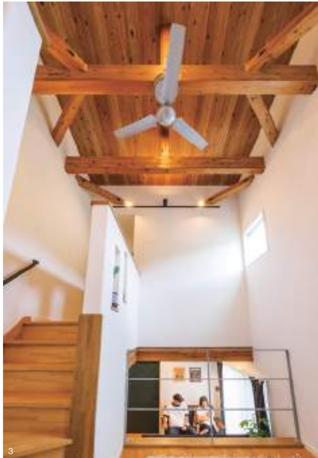
1. 表し梁とスキップフロアによってリッチさを醸し出すLDK。クロス仕上げの壁面の一部を板貼りにし、大人のナチュラル感をバランスよく演出。アメリカンスイッチや建具の色など細部にもこだわりが光る。2. インナーガレージは収納力抜群で、BBQ 道具やキャンプ用品もきれいに収まる。3. スキップフロアの吹き抜けは開放感たっぷり。梁と板貼りの天井のウッディーな美しさが際立つ。4. ダークなトーンの壁面とガレージスペースがヴィンテージなムードを印象付ける。