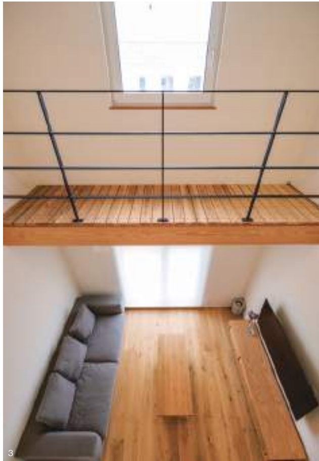
1. 家族が揃うLDKは、腰壁や柱を効果的に使ったり、天井高を変えたりすることで、さりげなくゾーニング。開放感そのままに、落ち着きある空間も生み出した。2. キッチン手前に立てた化粧柱は、玄関ホールからの視線をカットしつつ、空間のアクセントにも。リビングへの視線を遮る腰壁は、本棚としても活躍。3. 吹き抜けにはキャットウォークをプラス。無垢の木の床は下から見ても美しい。布団やカーペットを干すのにも便利だ。4. シンプルかつ洗練されたデザインの外観。