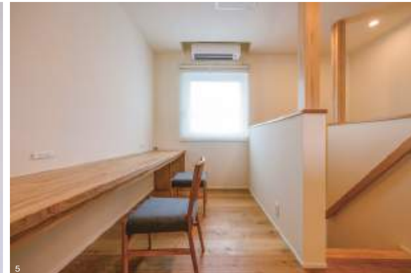
5. 2階ホールには、横長の机を設置。書斎やスタディスペースとして重宝しそう。6. キッチンから洗面やランドリー、浴室へとぐるりと回れる利便性の高い動線を確認。カウンターは高身長のご夫妻に合わせて、通常より高めのものに。7. 脱衣所と分けた洗面所には、奥様用のメイクスペース。8. パントリーを兼ねたキッチン脇の家事室には、事務作業や仕事を行えるデスクを造作。「すき間時間」を有効活用できそう。