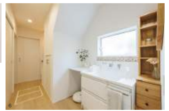
5. 天井高を1m上げた吹き抜けライクなリビング。掃出し開口の上に配置された間接照明が上方向への開放感を演出している。6. 階段までの動線には洗面コーナーと大容量収納を配置。ウォークインクローゼットにせず、押入れ式にしたのも奥様のこだわり。7. リビングのニッチ棚は、ソファの場所をあらかじめイメージして造られたもの。8. ダイニングの上にあたる大容量ロフトは、いわゆるスキップフロアのポジションに配置されている。