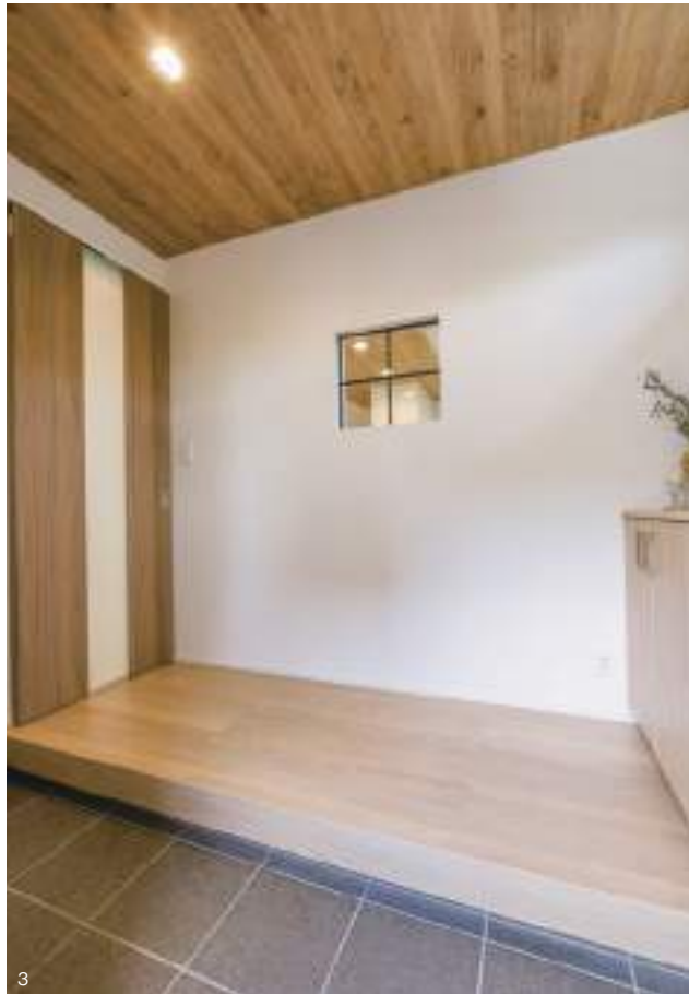
1.リビングとフラットに繋がる和室からみたLDK。和室の飾り棚やリビングコーナーを巧く使ったニッチ棚など隅々まで無駄のない空間設計が心地良い。2.ダイニング側の壁には書類などの整頓に使える2段式のデスクカウンターを設計。3.玄関フロアは、空間というより動線をイメージして、奥行きよりも横幅を重視した設計になっている。奥様こだわりの飾り窓が空間のシンプルさをより際立たせている。4.シンプルかつ清潔感を重視したという白垂の外観。