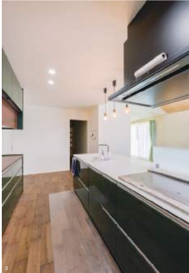
1.南向きの大開口が6面と勾配天井に2つの天窓と、圧倒的な開放感が魅力のLDK。キッチンの対面にダイニング、その横にリビングと、役割ごとの空間設計も使いやすそうだ。 2.ダイニングに隣接する和室を含めると27帖という日常空間が広がる。3.ご夫妻共々お気に入りというグリーンカラーのキッチン。4.緑のなかにひと際映えるクールなエクステリア。玄関ポーチ横に張り出したガレージの外壁はオリジナルパターンの銅板仕上げ。