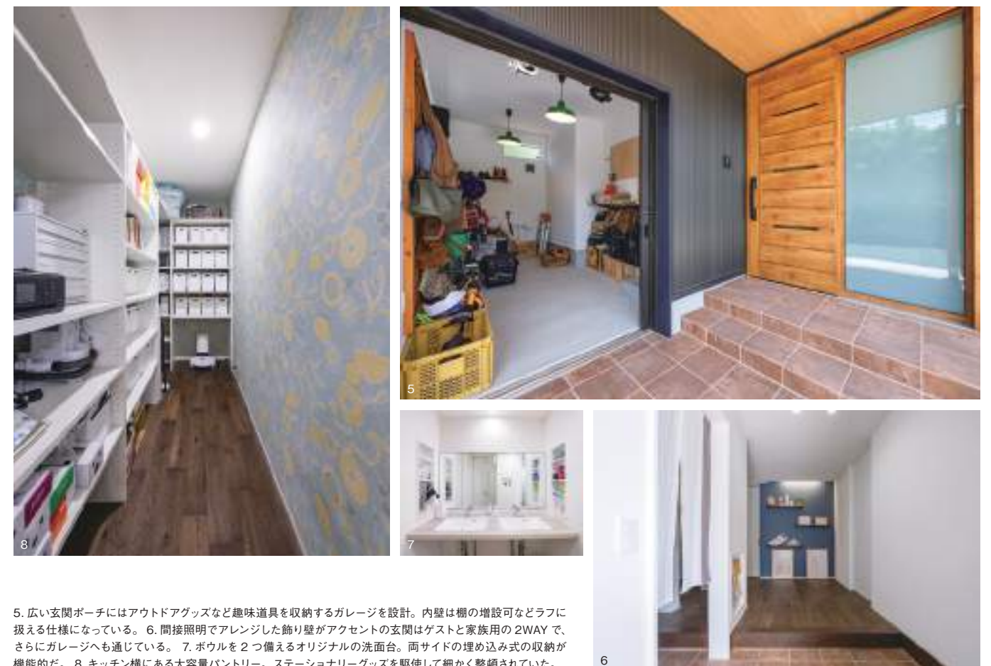
5. 広い玄関ポーチにはアウトドアグッズなど趣味道具を収納するガレージを設計。内壁は棚の増設可なドラフに扱える仕様になっている。6. 間接照明でアレンジした飾り壁がアクセントの玄関はゲストと家族用の2WAYで、さらにガレージへも通じている。7. ボウルを2つ備えるオリジナルの洗面台。両サイドの埋め込み式の収納が機能的だ。8. キッチン横にある大容量パントリー。ステーションナリーグッズを駆使して細かく整頓されていた。

南に開けた心地よいリビング共有スペースを大切に設計 「南向きの広いリビング」というご夫妻の要望を第一に考えられたH邸。私室を上階に配置できる二階建てに比べて、広いリビングの確保に制約のかかる平屋造りだが、収納などの機能空間を共有することで、私室部分の省スペースを図り、共有化した収納部分も大容量にしたり、廊下兼用ウォークスルータイプにしたりするなど、無駄のない空間づくりが徹底されている。こうして実現したLDKは、和室も含めて27帖という広さに加え、南面には掃き出し窓を6面と、平屋ならではのリビング天窓を2つ設えて明るさプラス開放感たっぷり空間に仕上がっている。また『FPの家』自慢の気密断熱性能も「夏でも冬でもリビングのエアコン1台で家中すべてが快適で驚いています」と、理想の間取りを支える住宅性能にご夫妻も大満足だ。