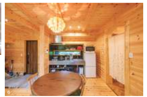
5. 16帖ある2階(ロフト)はシンプルなもの。小さな子どもたちにとっては毎日がアドベンチャー気分だろう。 6. コンパクトながら必要なものがすべて詰め込まれたキッチン。この環境においてはステンレス製の質実剛健な造りがむしろ安心感となる。 7. 隣家どころか人っ子ひとりりない環境なのでシェード不要のバスルーム。檜風呂や岩風呂ではなくユニットバスというのが住宅たる所以だ。 8. 無垢の不規則な節文様が室内に温かみを与えている。