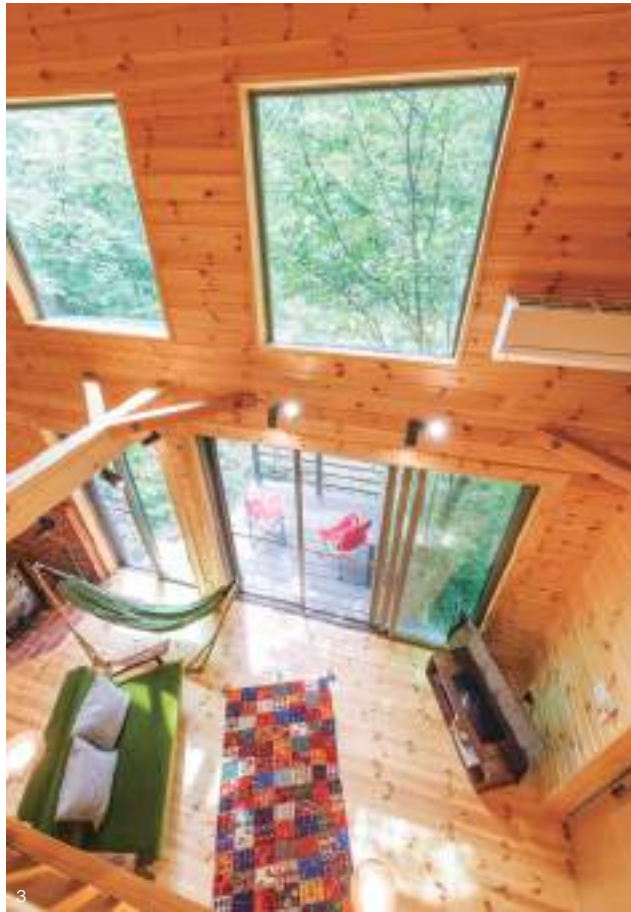
1. 左奥にはキッチン、右奥には薪ストーブと、この家のすべてが集約されている吹き抜けの大空間。手前左側に見えるグレータイル地の玄関土間部分も、リビングの一部として設計されている。2. 薪ストーブ側から見たリビング。野趣あふれるキッチンが無垢の空間によく似合う。3. ロフトからの眺め。窓がこの家にとっていかに重要な役割を担っているのかが分かる。窓外の緑が美しい。4. 鬱蒼とした緑のなかにポツンと佇む。環境も考慮して、外壁は防虫効果のある焼杉仕様に。