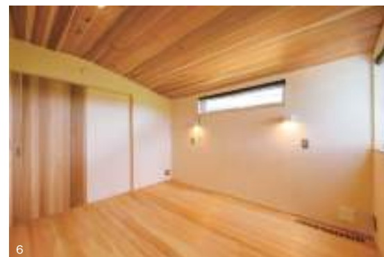
5. 土間収納を備えた広い玄関。LDKとの境はガラス入りの格子戸で区切り、光を通しつつも室内を目隠し。6. 木に包まれるようなデザインの寝室。あえて低くした天井は穏やかな眠りに誘い込んでくれそう。7. 将来的には二つに仕切れるよう設計した子ども部屋。お子さんが小さいうちは一部屋を広く使えて便利。8. リモコンスイッチは廊下のニッチにひとまとめ。レトロ感あるトグルスイッチは空間のアクセントにも。