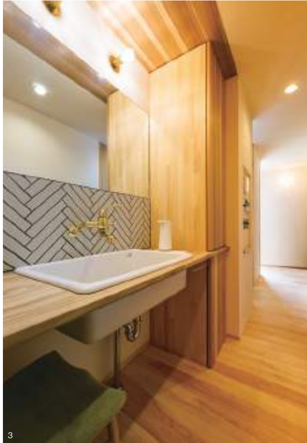
1. 無垢材に囲まれ、温もり感あふれるLDK。最大幅2.5メートル超の特注窓ガラスからは、四季折々の自然豊かな風景をまるで絵画のように楽しむことができる。2. 勾配天井がダイナミックな開放感を生み出しているキッチンとダイニングに比し、リビングはあえて天井を低くして落ち着いた雰囲気。3. 幾何学模様のタイルと真鍮の水栓蛇口でおしゃれに仕上げた洗面台。玄関からのアクセスが良く、来客時にも重宝。4. 杉板と黒のガルバリウム鋼板を組み合わせた個性的な外観。