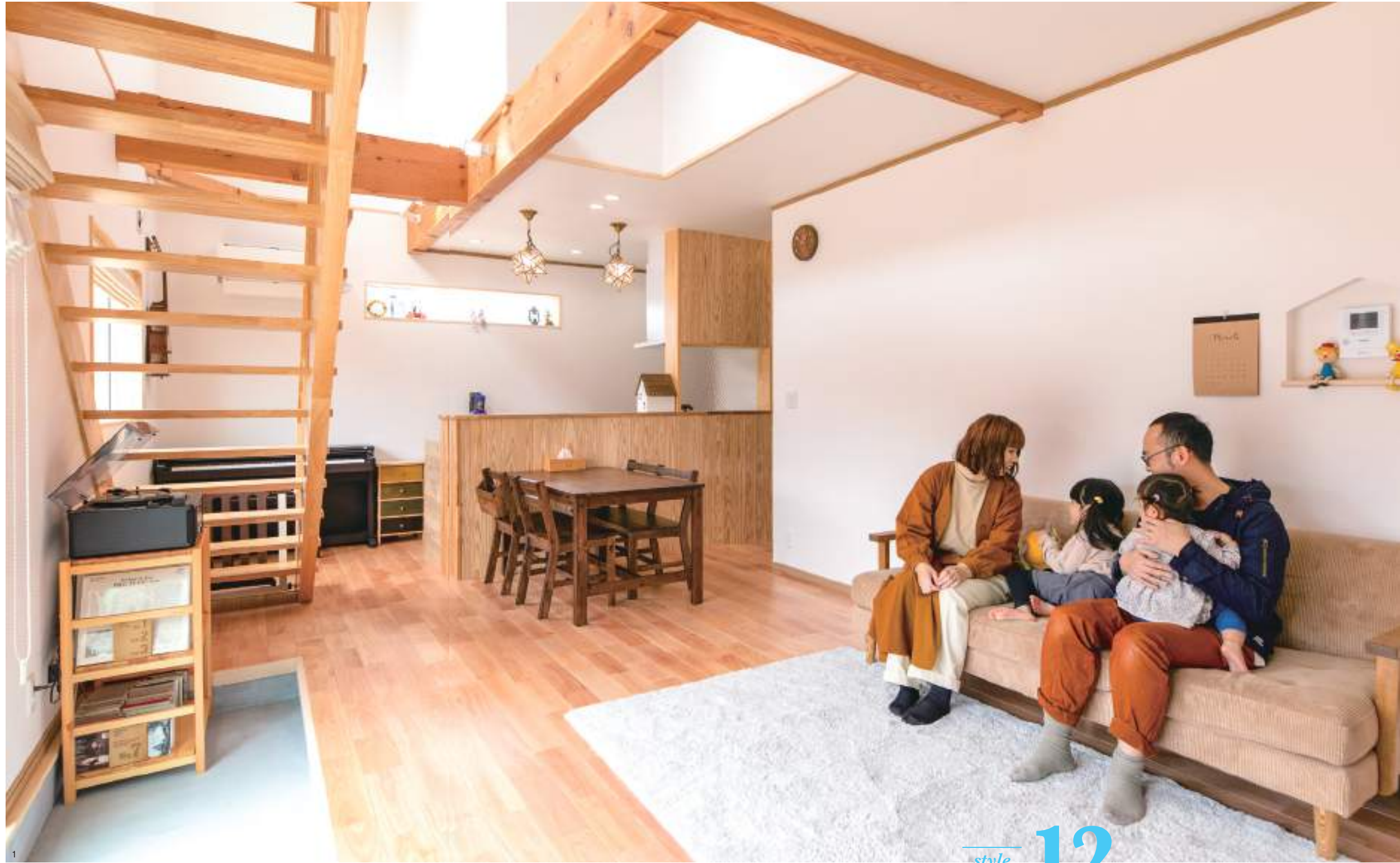
1. 邸自慢の吹き抜け土間リビング。極太の梁づかいなど、モダンに構成された空間を伝統建築の技術がしっかりと支えている。2. 趣味のオーディオコーナーを配置した土間リビング。掃き出しの外に広いウッドデッキが近々完成する。3. 家の全長をたっぷり使って土間の上を斜めに走るスケルトン階段が吹き抜けの空間を引き締める。4. シンプルな三角屋根のフォルムを生かした玄関周りデザインが特徴的な外観。