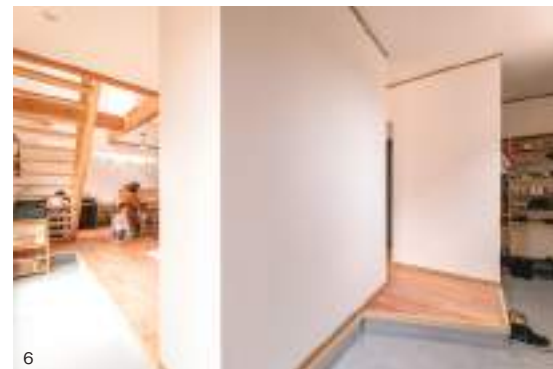
5. 奥様の好きなものを詰め込んだキッチンは回廊スタイルで機動性抜群。リビングから見えないコーナーに大 容量の収納を配置する工夫も。6. リビングを囲むL字土間の奥には仕切りを隔てて家族用シューズクロックを設 計。7. リビングが見渡せる2階寝室の窓。両開きスタイルで遊び心をプラス。8. ポップなストライプ柄クロス でアレンジされた1階トイレ。おしゃれなボウルの置かれた手洗台はもちろんオリジナルメイド。